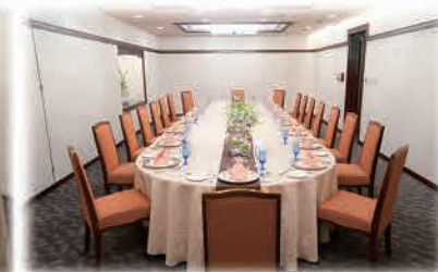
10～20名様までの個室も完備