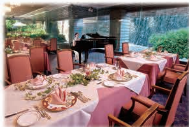
開放感溢れる落ち着いた店内