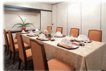
4～10名様様の寛ぎの個室