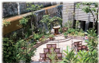
緑豊かな吹き流れるガーデン