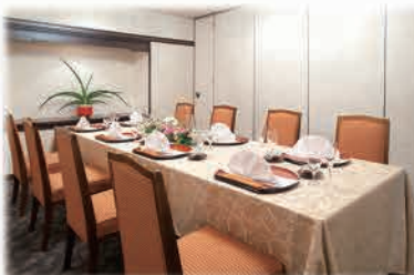
4～10名様様の寛ぎの個室