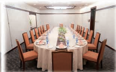
10～20名様までの個室も完備