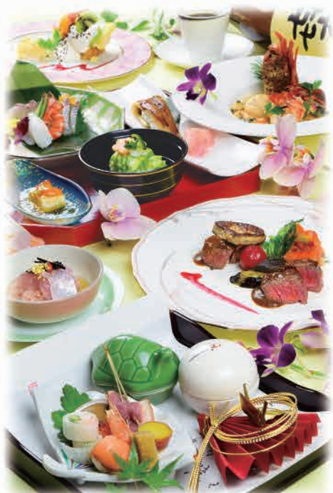
シェフおすすめフランス料理イメージ