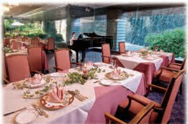
開放感溢れる落ち着いた店内